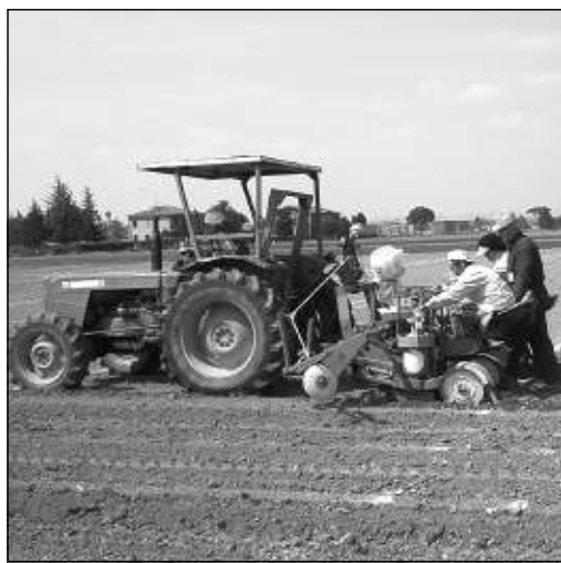
Lavoro nei campi

Il problema più scottante riguarda la sanatoria dei pozzi. Gli agricoltori hanno presentato negli anni le varie denunce di attingimento dai pozzi e pare che l'Autorità di bacino boc-